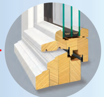
Wasserschmel auf Flügel und Blendrahmen